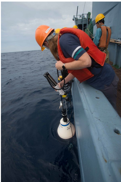
米国製の音響観測機器を投入する国際調査員（2023年）