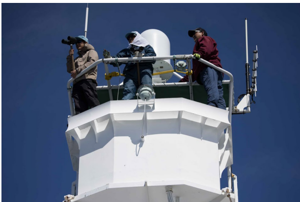
観察台から鯨種を確認する観察員と国際調査員（2023年）