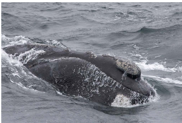
希少種とされるセミクジラの頭部 (2023年)