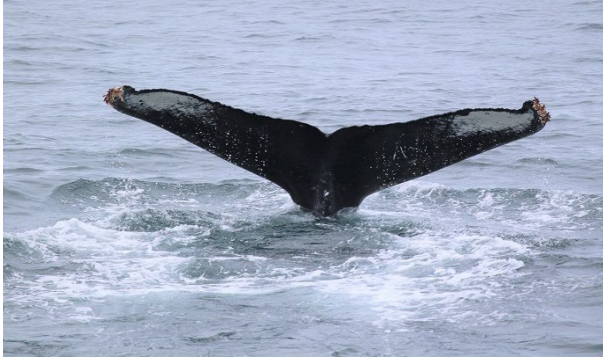
アリューシャン列島付近で撮影されたザトウクジラの尾びれ（2022年）