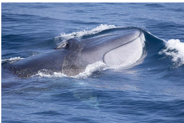
海面に浮上したナガスクジラ。右下顎が白い。(2023年)