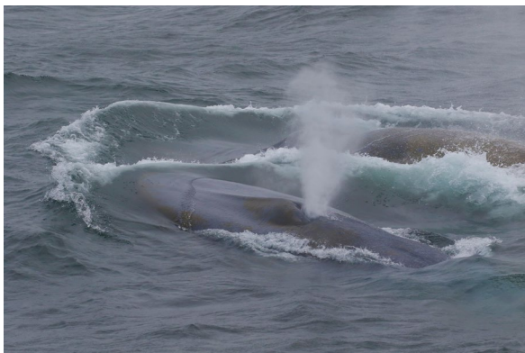
海面で呼吸をするシロナガスクジラ (2022年)