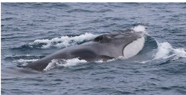
海面に浮上してきたナガスクジラ (2021年)