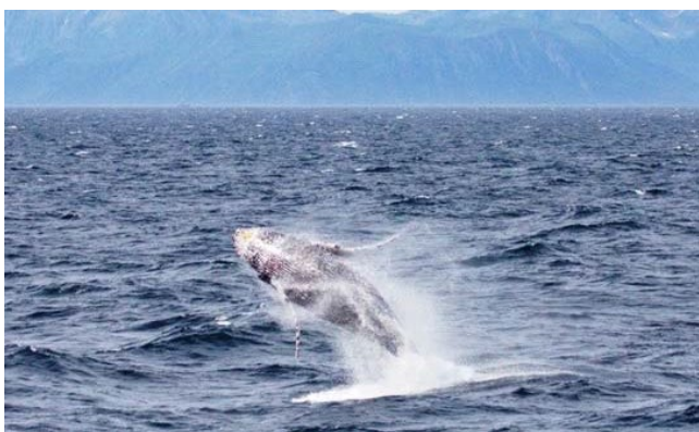
アラスカ湾のザトウクジラのブリーチング (2012年)