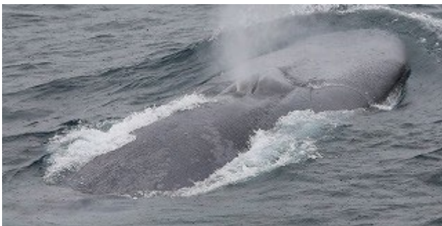
海面で呼吸をするシロナガスクジラ (2021年)