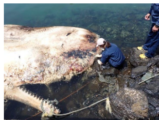
写真. 表皮標本の採取