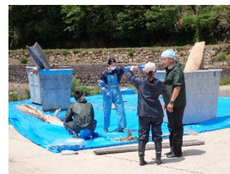
写真. 下顎歯の採取