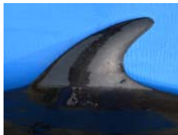
鯨体の特徴 背鰭 (クロミンククジラ)