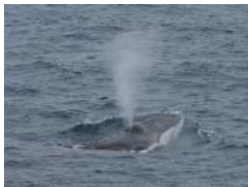
南極海における野生動物 (ナガスクジラ)