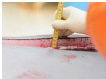
鯨体生物調査 脂皮厚計測 (クロミンククジラ)