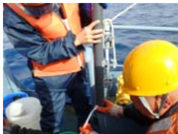
海洋観測風景 (採水器による採水)