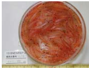
餌生物調査による 採集試料 (ナンキョクオキアミ)