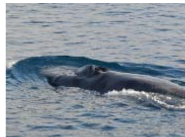
南極海における野生動物 (シロナガスクジラ)