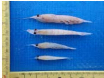
胃内容物 コオリオキアミ (クロミンククジラ)