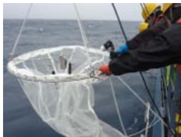
餌生物調査風景 (ネットサンプリング)