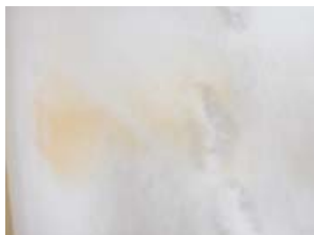
体表に付着した 珪藻類 (クロミンククジラ)