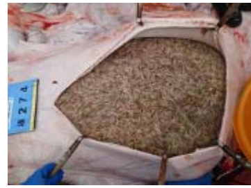
胃内容物 ナンキョクオキアミ (クロミンククジラ)