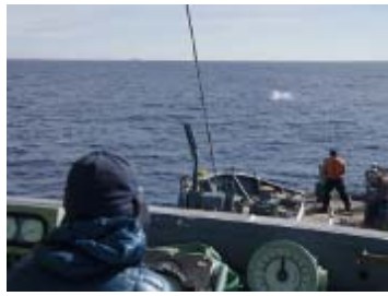
目視採集調査 選択個体の採集 (クロミンククジラ)