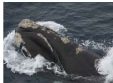
非致命的調査 自然標識撮影による 外見上の特徴記録 (ミナミセミクジラ)