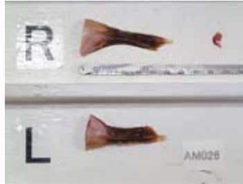
採集された年齢形質 耳垢栓 (クロミンククジラ)