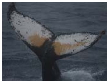
非致命的調査 自然標識撮影による 外見上の特徴記録 (ザトウクジラ)