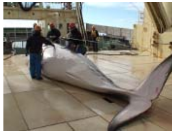
鯨体生物調査 プロポーシオン計測 (クロミンククジラ)