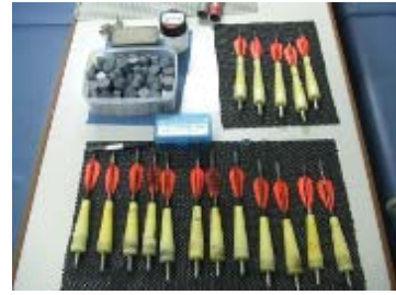
非致命的調査 (バイオプシー採集機材)