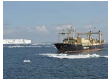
調査母船日新丸 (捕獲調査)