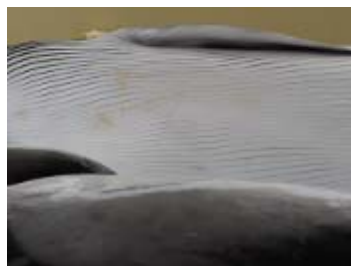
鯨体生物調査によって 確認された腹部の珪藻類 (クロミンククジラ)