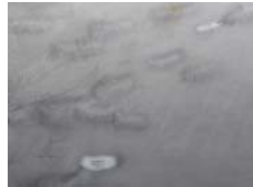
繁殖海域の情報を探る ダルマザメ噛み痕 (クロミンククジラ)