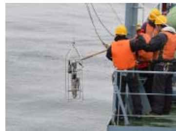
海洋観測風景 (CTDによる海洋観測)