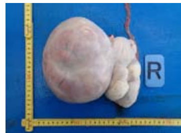
採集された生殖腺 卵巣と黄体 (クロミンククジラ)