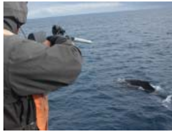
非致命的調査 バイオプシー標本の 採集 (ザトウクジラ)