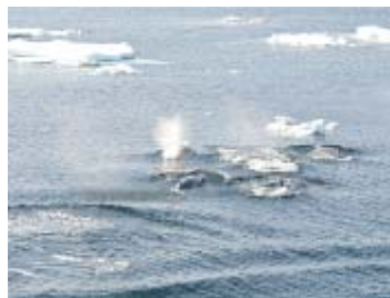
パックアイス内の クジラの群れ (クロミンククジラ)