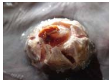
回遊情報につながる クロミンククジラ体表の 付着生物 (フジツボ)