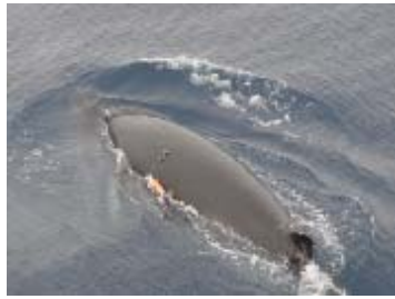
非致命的調査 衛星標識装着実験 (クロミンククジラ)