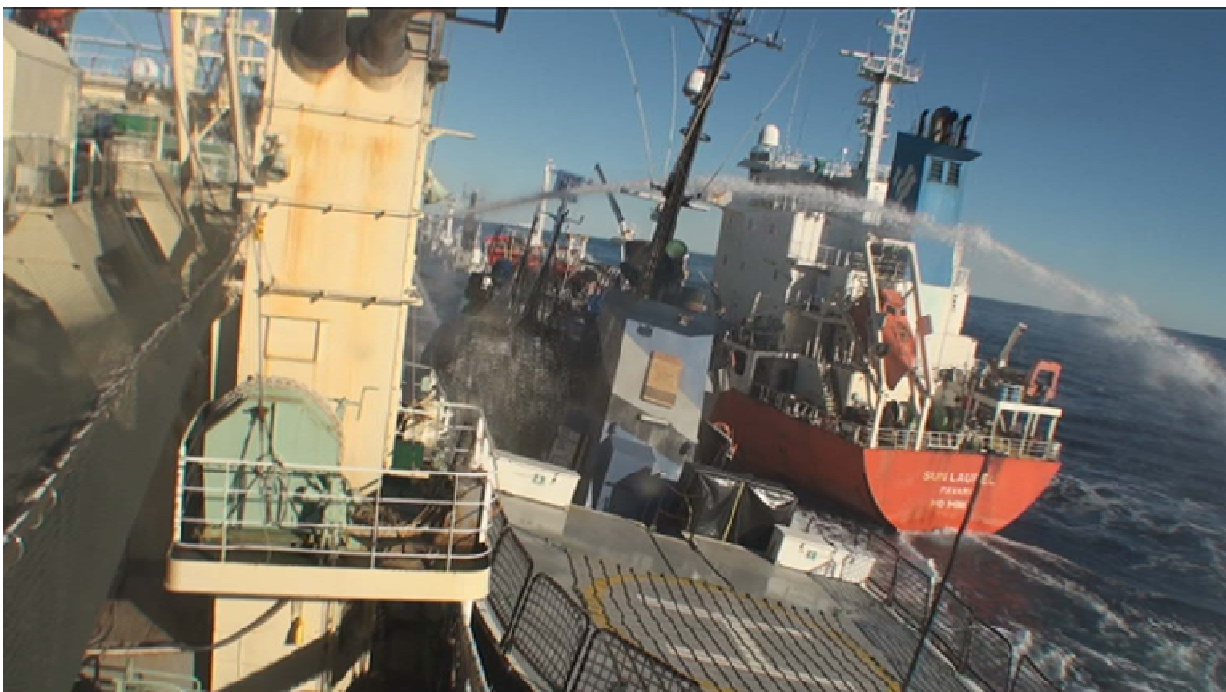
4. 写真3と同じ場면을船尾側から撮影 (2013年2月25日)