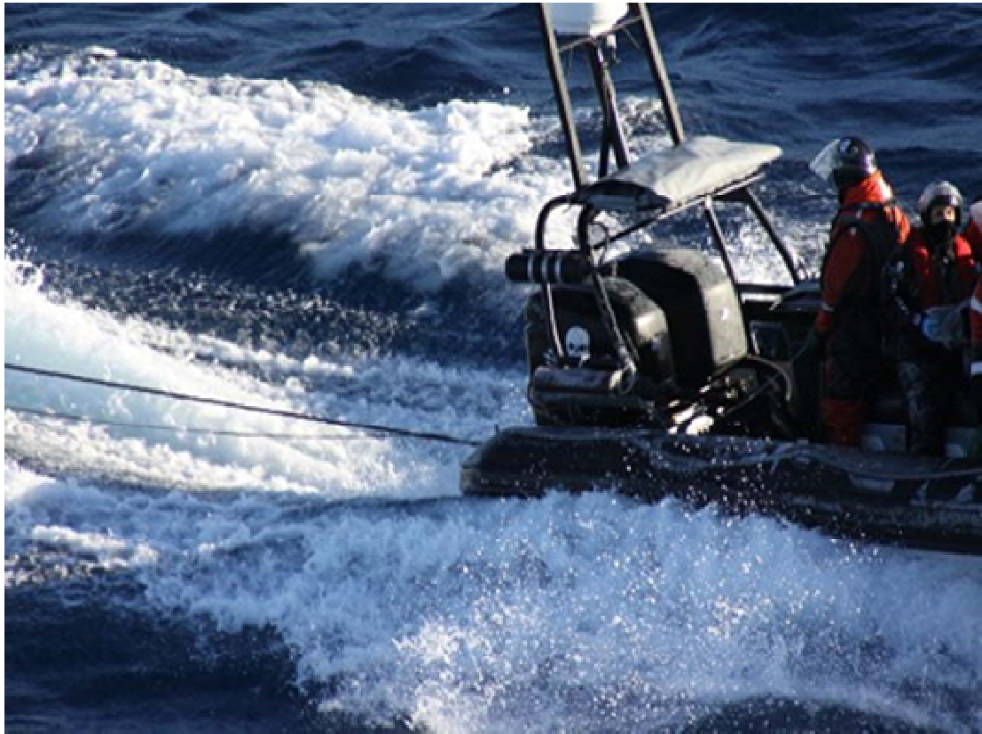
5. ワイヤーとロープを曳航して調査船のプロペラを狙う SS ボート (2013 年 2 月 25 日)