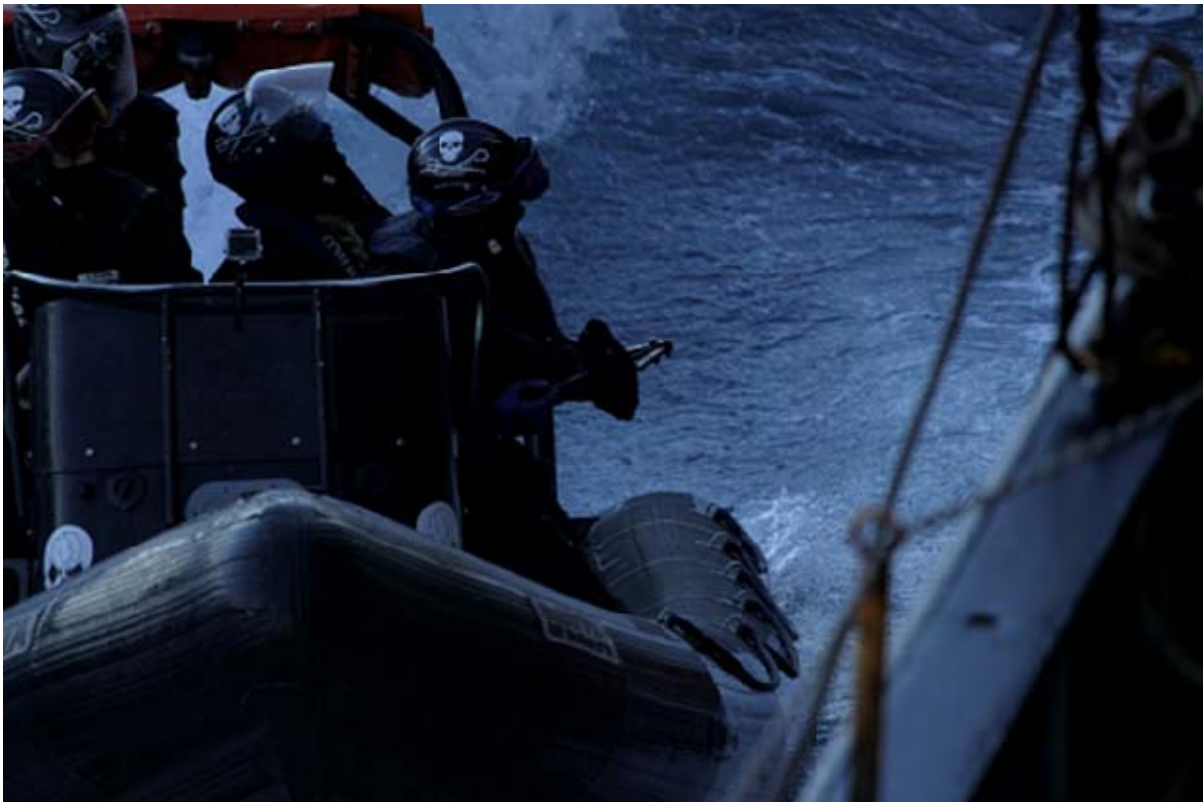
6. SS 活動家が手に持っている装置を NM の排水口に挿入した (2013 年 2 月 25 日)