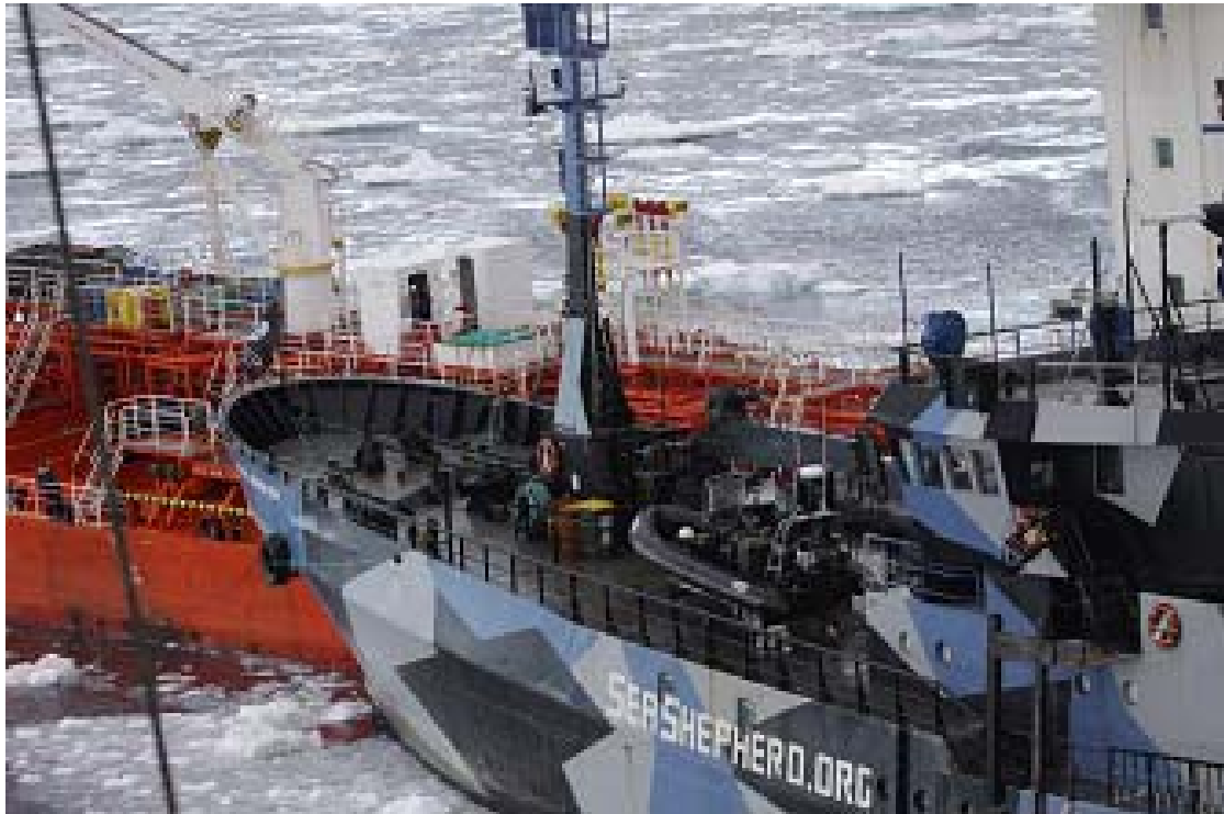
1. タンカーに体当たりするBB号 (2013年2月20日)

http://www.icrwhale.org/gpandseaJapane.html